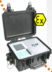
Áramlás- és mennyiségmérés