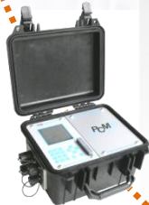
Áramlás- és mennyiségmérés