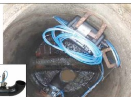
Mérési pont a csatornában